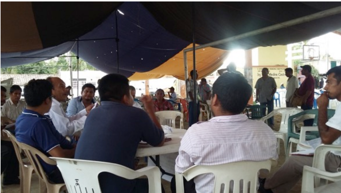
Mesa de trabajo discutiendo el tema de educación intercultural y sistema normativo interno en el municipio de San Marcos, estado de Guerrero.