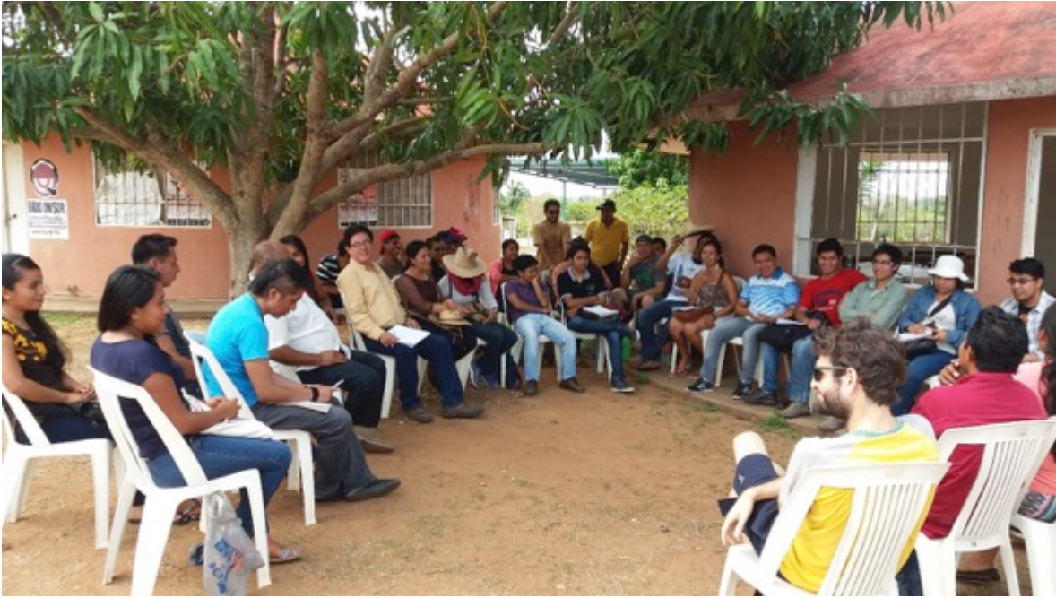
Sede de la Universidad de los Pueblos del Sur en el municipio de Cuajinicuilapa, estado de Guerrero. Taller sobre “Justicia y derechos humanos” impartido por miembros de la Red Mexicana de Estudios de los Movimientos Sociales.