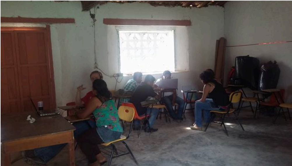
Sede de la Universidad de los Pueblos del Sur (UNISUR) en el municipio de Malinaltepec, estado de Guerrero. Taller de "Identidad" impartido por miembros de la Red Mexicana de Estudios de los Movimientos Sociales.