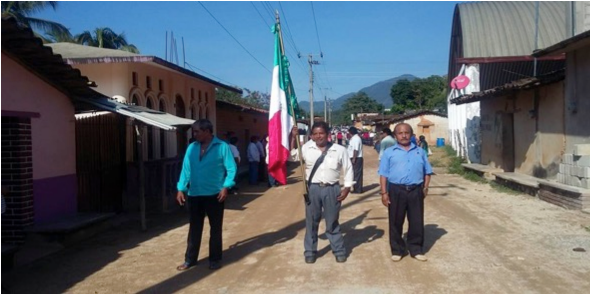
Manifestación pública por los 21 años de la Coordinadora Regional de Autoridades Comunitarias en el municipio de Malinaltepec, estado de Guerrero. Octubre de 2016.