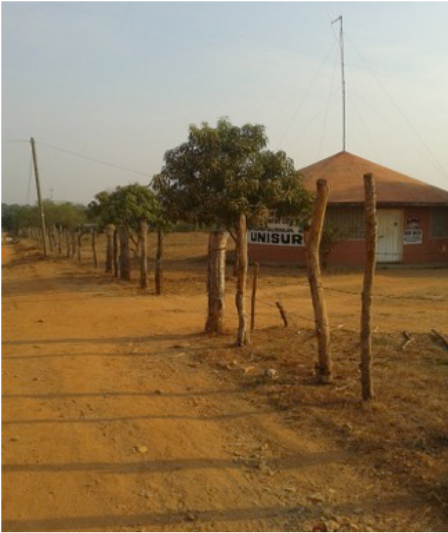
Sede de la Universidad de los Pueblos del Sur (UNISUR) en el Municipio de Cuajinicuilapa.