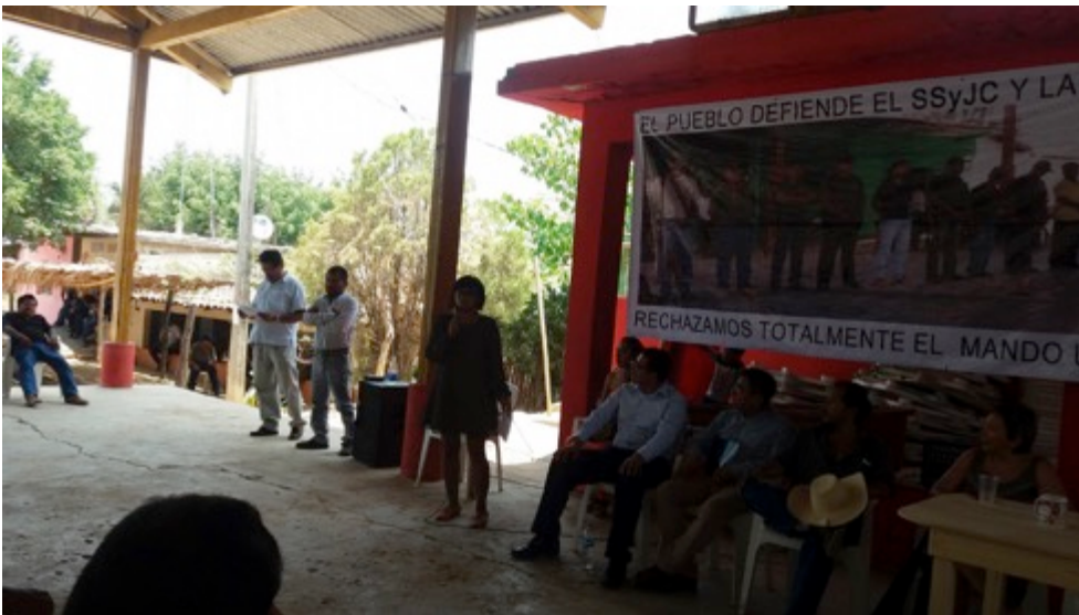
Asamblea Comunitaria realizada por la Unión de Pueblos y Organizaciones del Estado de Guerrero (UPOEG) discutiendo el tema de sistema normativo interno. Municipio de Ayutla de los Libres. Septiembre de 2016