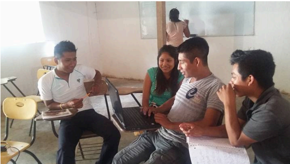
Sede de la Universidad de los Pueblos del Sur (UNISUR) en el municipio de Malinaltepec, estado de Guerrero. Taller sobre "Identidad" impartido por miembros de la Red Mexicana de Estudios de los Movimientos Sociales.