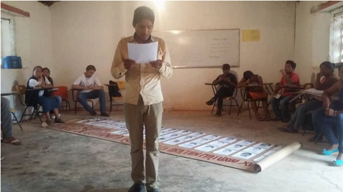
Sede de la Universidad de los Pueblos del Sur en el municipio de Malinaltepec, estado de Guerrero. Taller de oratoria, impartido por miembros de la Red Mexicana de Estudios de los Movimientos Sociales.