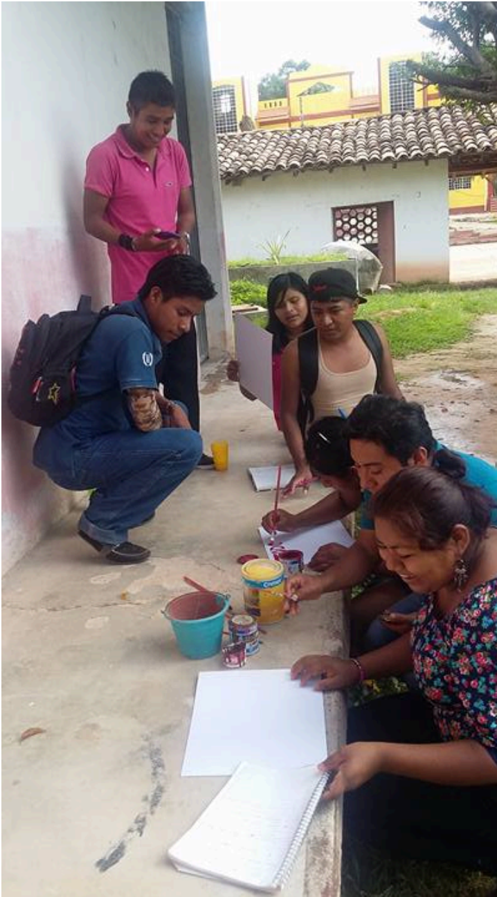
Sede de la Universidad de los Pueblos del Sur en el municipio de Malinaltepec, estado de Guerrero. Taller de “Defensa de los derechos humanos” impartido por miembros de la Red Mexicana de Estudios de los Movimientos Sociales.