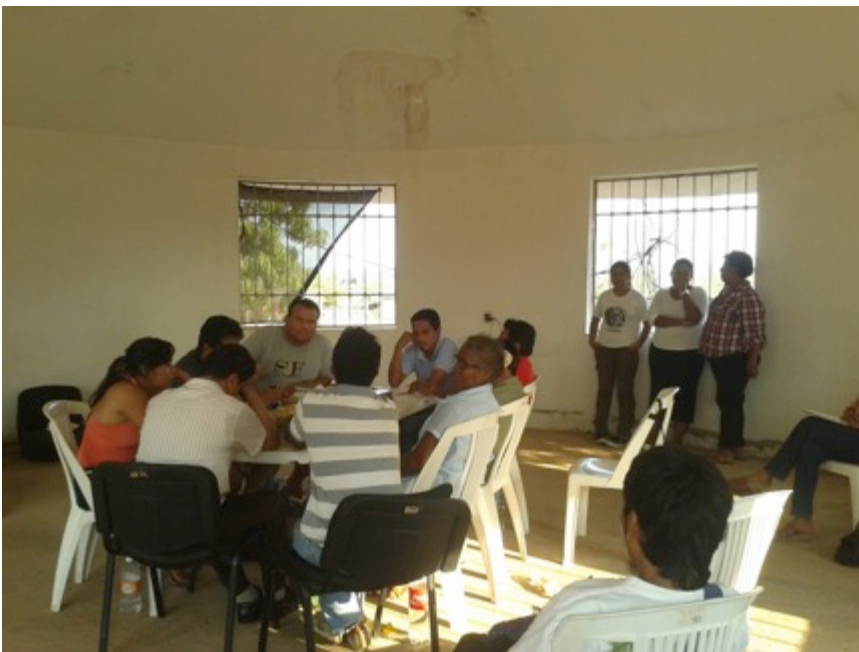
Formación de capital humano en la Universidad de los Pueblos del Sur (UNISUR). Municipio de Cuajinicuilapa. Curso-taller “cómo defender tus derechos” impartido por miembros de la Red Mexicana de Estudios de los Movimientos Sociales. Agosto de 2016