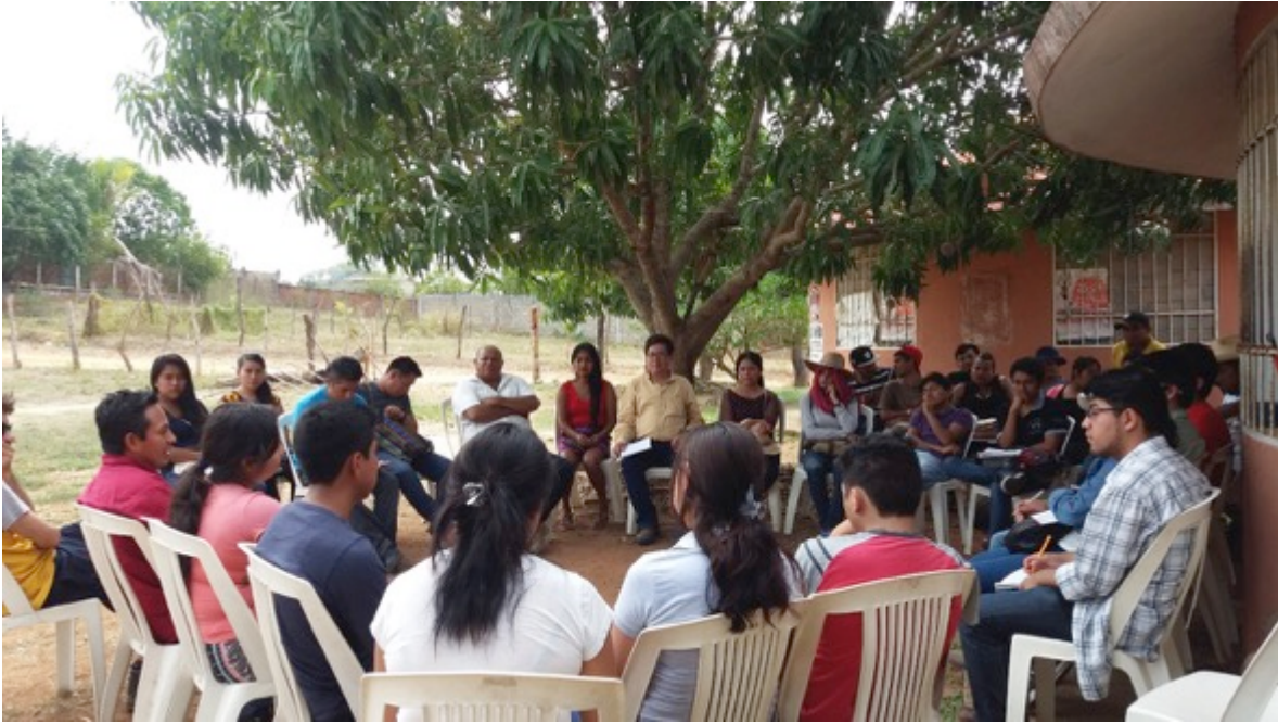
Sede de la Universidad de los Pueblos del Sur en el municipio de Cuajinicuilapa, estado de Guerrero. Taller de “Justicia y derechos humanos” impartido por miembros de la Red Mexicana de Estudios de los Movimientos Sociales.