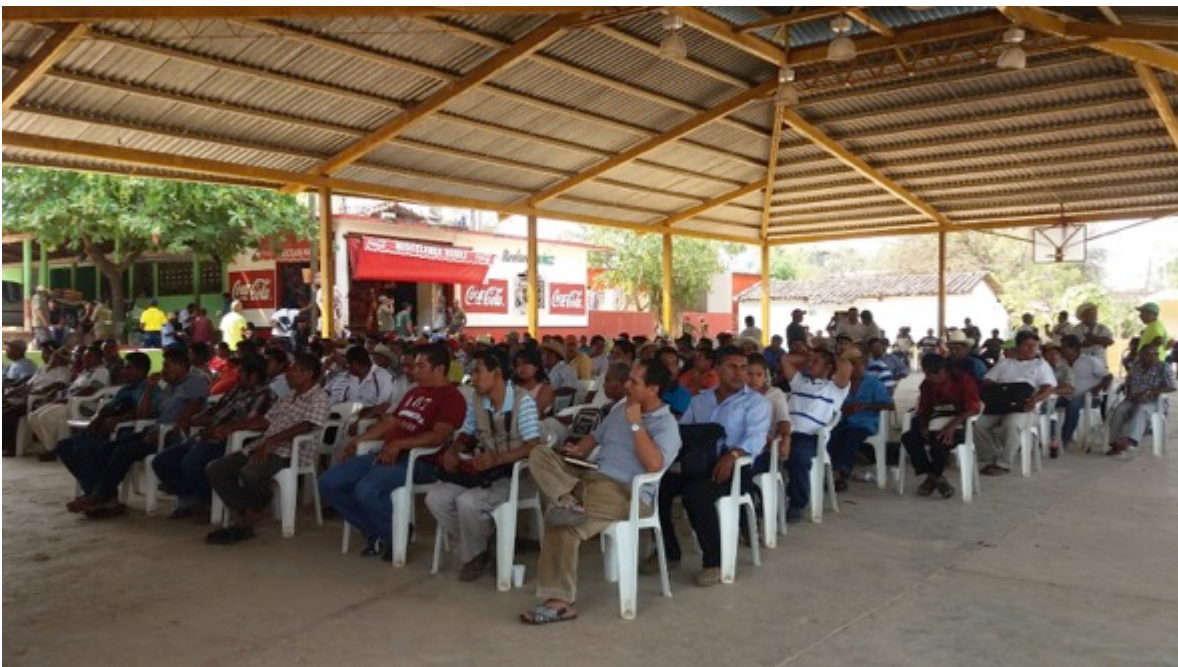
Asamblea comunitaria en el municipio de Ayutla de los Libres en el estado de Guerrero, ciudadanos discutiendo sobre la importancia de la defensa de los derechos humanos.