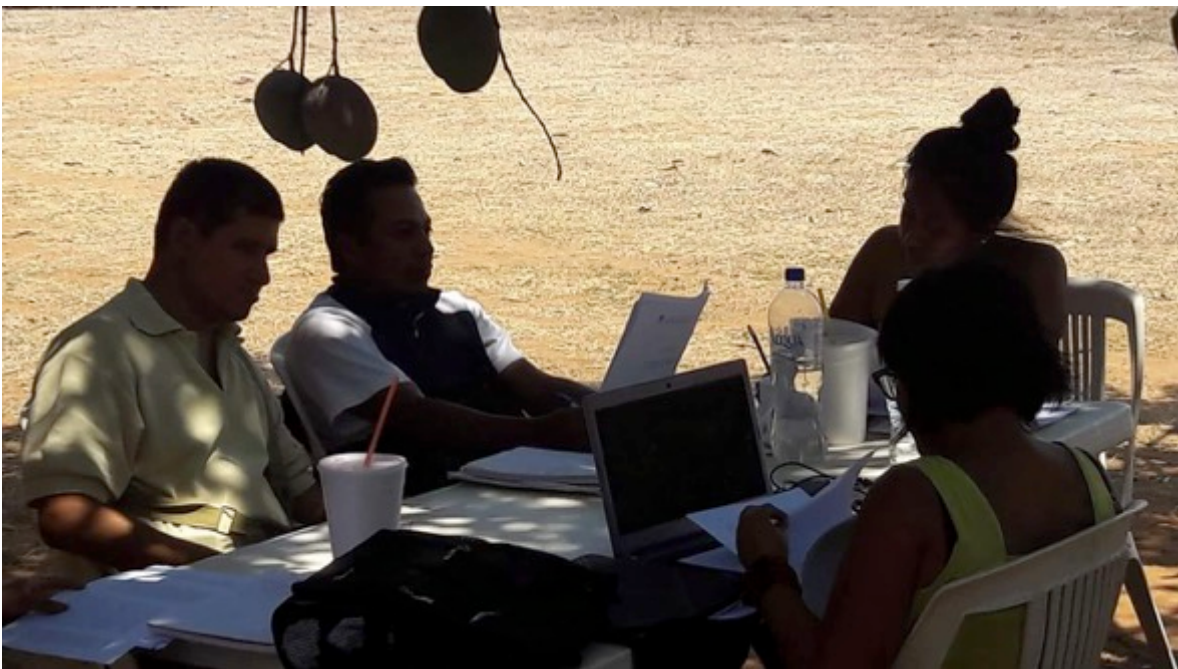
Formación de capital humano en la Universidad de los Pueblos del Sur (UNISUR). Municipio de Cuajinicuilapa. Curso-taller "Cómo defender tus derechos" impartido por miembros de la Red Mexicana de Estudios de los Movimientos Sociales. Agosto de 2016