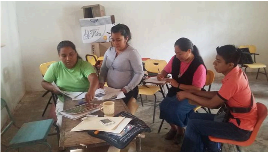
Sede de la Universidad de los Pueblos del Sur en el municipio de Malinaltepec, estado de Guerrero. Taller de "Identidad" impartido por miembros de la Red Mexicana de Estudios de los Movimientos Sociales.