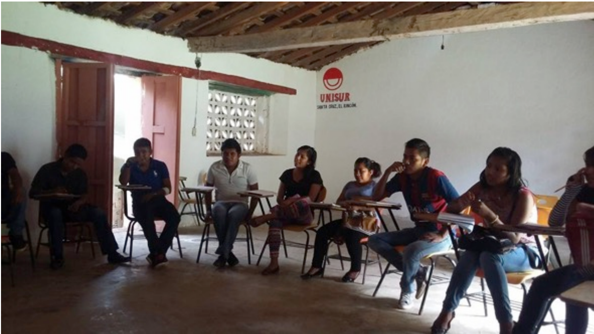
Sede de la Universidad de los Pueblos del Sur en el municipio de Malinaltepec, estado de Guerrero. Taller de oratoria, impartido por miembros de la Red Mexicana de Estudios de los Movimientos Sociales.