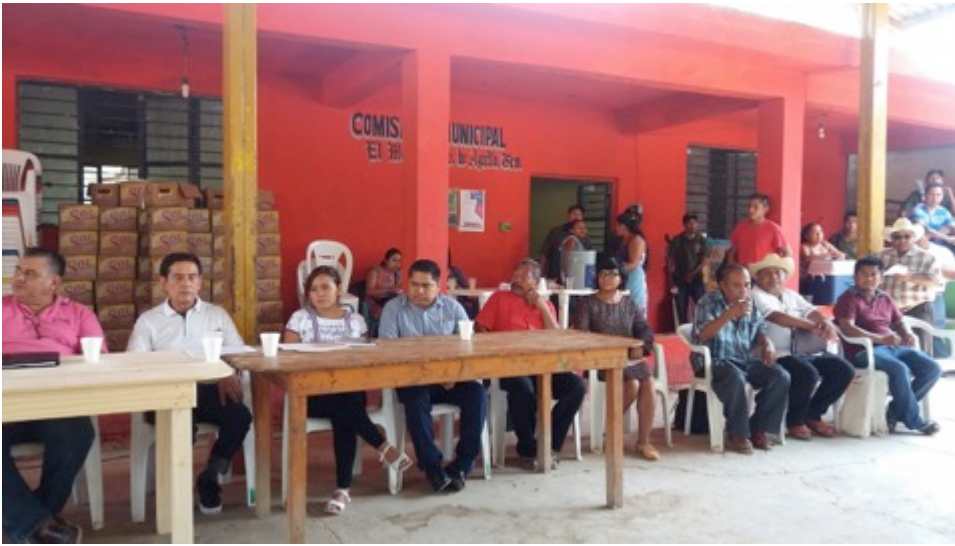
Asamblea Comunitaria realizada por la Unión de Pueblos y Organizaciones del Estado de Guerrero (UPOEG) analizando el sistema normativo interno. Municipio de Ayutla de los Libres. Septiembre de 2016