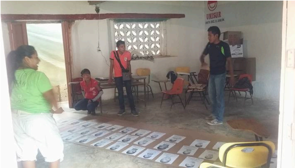
Sede de la Universidad de los Pueblos del Sur en el municipio de Malinaltepec, estado de Guerrero. Taller de defensa de los derechos humanos impartido por miembros de la Red Mexicana de Estudios de los Movimientos Sociales.